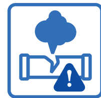
Détecteur de fuite sur TOUTES les unités murales