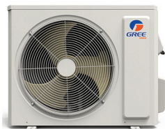
Condenseur VITA R32