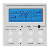
EN OPTION Thermostat filaire XE-71